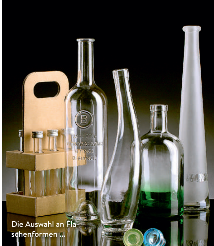
Die Auswahl an Flaschenformen ...