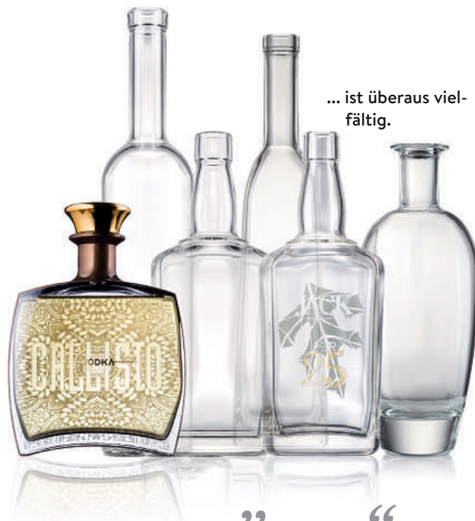
... ist überaus vielfältig.